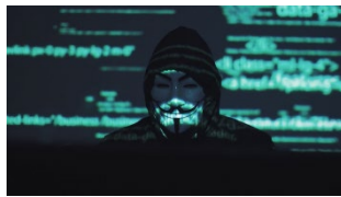
AI og EU's AI Act, 2023