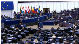
Strategisk autonomi i EU, 2022